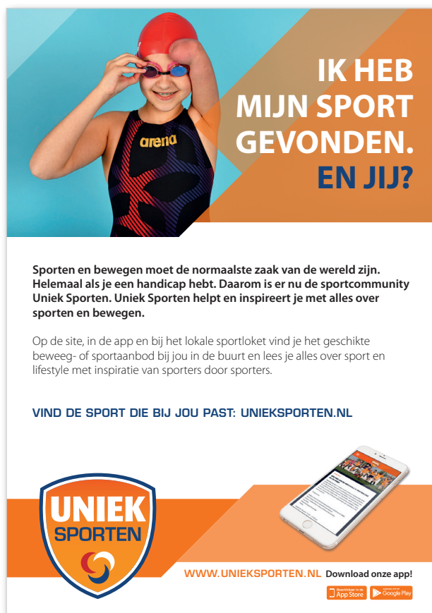
Voorbeeld eigen advertentie/flyer Uniek Sporten

Op de website communicatie.unieksporten.nl leest u alles over het gebruik van deze stramienen met inzet van de grafisch vormgevers van Buro Zutphen. Uw publicatie kan door Buro Zutphen worden opgemaakt met door u aangeleverde teksten en beelden en eventueel ook direct worden gedrukt.