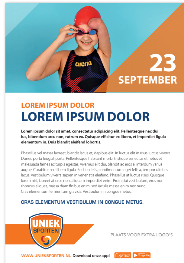
Voorbeeld advertentie/flyer regionaal sportloket