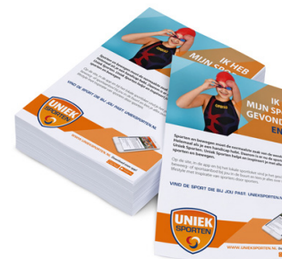
Flyers en folders